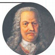
Акимфий Никитич Демидов (1678-1745)