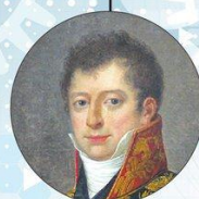
Николай Никитич (1773-1828)

Знаменитая династия Демидовых, основоположников металлургического производства России, известна не только огромным вкладом в развитие промышленности страны, но и своей благотворительностью. Представители данной династии опекали Московский университет и основали стипендию для студентов из малообеспеченных семей. Ими было открыто первое коммерческое училище для купеческих семей. Постоянно помогали Демидовы Воспитательному дому. Одновременно они занимались собиранием художественной коллекции. Она стала самой крупной в мире из частных собраний